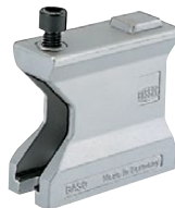
Trou de montage ouvert